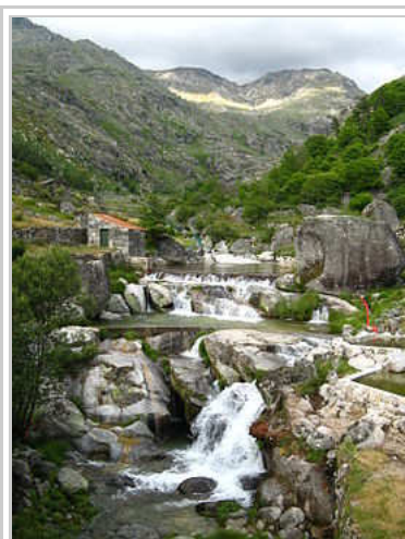
Praia fluvial de Loriga, conhecida também como Chão da Ribeira onde existe o chamado "Poço do Zé Lages".

O bairro de São Ginês (São Gens) é um bairro do centro histórico de Loriga cujas características o tornam num dos bairros mais típicos da vila. Curioso é o facto de este bairro dever o nome a São Gens, um santo de origem céltica martirizado em Arles, na Gália, no tempo do imperador Diocleciano, orago de uma ermida visigótica situada na área, no local onde hoje está a capela de Nossa Senhora do Carmo. Com o passar dos séculos os loriguenses mudaram o nome do santo para São Ginês, que nunca existiu, deixaram arruinar a capela que lhe era dedicada e finalmente reconstruíram-na mas mudaram-lhe o orago para Nossa Senhora do Carmo. Este núcleo da povoação, que já esteve separado do principal e mais antigo, situado mais abaixo, é anterior à chegada dos romanos.