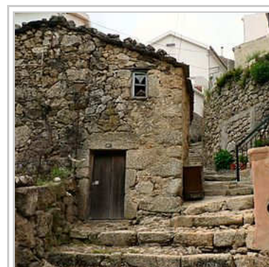
Rua da Oliveira

A rua da Oliveira é uma rua situada no centro histórico da vila. A sua escadaria tem cerca de 80 degraus em granito, o que lhe dá características peculiares. Esta rua recorda muitas das características urbanas medievais.