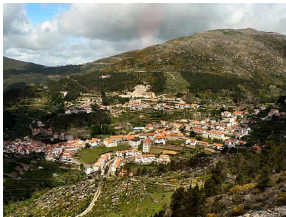
Vista geral de Loriga