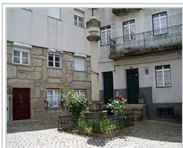
Largo do Pelourinho.

A partir da segunda metade do século XIX tornou-se um dos principais pólos industriais da Beira Alta, com o aumento e desenvolvimento da indústria dos lanifícios, que entrou em declínio durante as últimas duas décadas do século passado o que está a levar à desertificação da Vila, facto que afecta de maneira geral as regiões interiores de Portugal. Actualmente a economia loriguense baseia-se nas indústrias metalúrgica e de panificação, no comércio, restauração, alguma indústria de malhas que ainda resiste, e alguma agricultura e pastorícia.