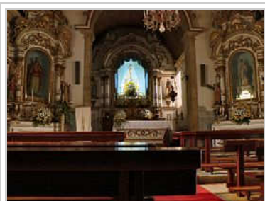
Igreja Matriz de Loriga - vista interior.

Fundada originalmente no alto de uma colina entre ribeiras onde hoje existe o centro histórico da vila. O local foi escolhido há mais de dois mil e seiscentos anos devido à facilidade de defesa (uma colina entre ribeiras), à abundância de água e de pastos, bem como ao facto de as terras mais baixas providenciarem alguma caça e condições mínimas para a prática da agricultura. Desta forma estavam garantidas as condições mínimas de sobrevivência para uma população e povoação com alguma importância.