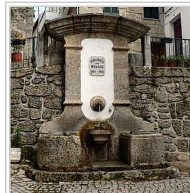
Fontanário em Loriga.