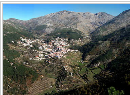
Vista panorâmica de Loriga e do vale glaciário com o mesmo nome, semelhante a uma paisagem alpina.

Loriga, situada na parte sudoeste da Serra da Estrela, encontra-se a 20 km de Seia, 80 km da Guarda e 320 km de Lisboa. A vila é acessível pela EN 231 e pela EN 338, estrada concluída em 2006, seguindo um traçado pré-existente, com um percurso de 9,2 km de paisagens de montanha, entre as cotas 960 m (Portela de Loriga ou do Arão) e 1650 m, um pouco acima da Lagoa Comprida.