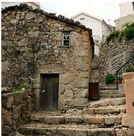
Rua da Oliveira

A rua da Oliveira é uma rua situada no centro histórico da vila. A sua escadaria tem cerca de 80 degraus em granito , o que lhe dá características peculiares. Esta rua recorda muitas das características urbanas medievais.