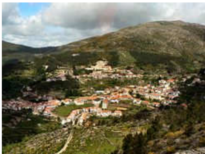
Vista geral de Loriga