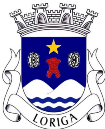
Brasão de Loriga