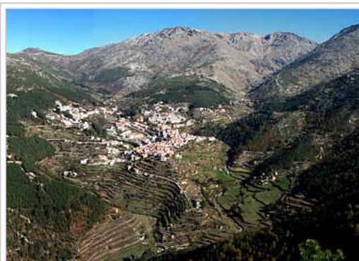
Vista panorâmica de Loriga e do vale glaciário com o mesmo nome, semelhante a uma paisagem alpina.

Loriga, situada na parte sudoeste da Serra da Estrela, encontra-se a 20 km de Seia, 80 km da Guarda e 320 km de Lisboa. A vila é acessível pela EN 231 e pela EN 338, estrada concluída em 2006, seguindo um projeto e um traçado pré-existent, com um percurso de 9,2 km de paisagens de montanha, entre as cotas 960 m (Portela do Arão) e 1650 m, junto à Lagoa Comprida.