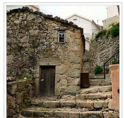
Rua da Oliveira

A rua da Oliveira é uma rua situada no centro histórico da vila. A sua escadaria tem cerca de 80 degraus em granito, o que lhe dá características peculiares. Esta rua recorda muitas das características urbanas medievais desta vila histórica. O bairro de São Ginês é um bairro do centro histórico de Loriga cujas características o tornam num dos bairros mais típicos da vila. Curioso é o facto de este bairro dever o nome a São Gens, um santo de origem céltica martirizado em Arles, na Gália, no tempo do imperador Diocleciano, orago de uma ermida visigótica situada na área, no local onde hoje está a capela de Nossa Senhora do Carmo. Com o passar dos séculos os loriguenses deixaram