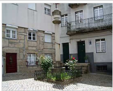
Largo do Pelourinho, vendo-se o edifício da antiga Câmara Municipal entretanto adaptado a residência particular.