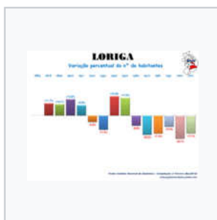
Variação da População 1864 / 2011