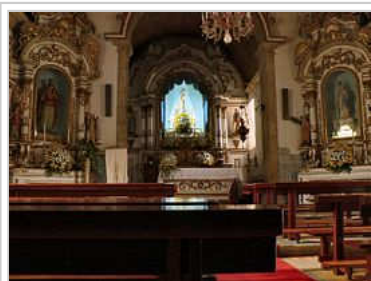
Igreja Matriz da vila dedicada a Santa Maria Maior, padroeira de Loriga - vista interior.

Fundada originalmente no alto de uma colina entre ribeiras onde hoje existe o centro histórico da vila. O local foi escolhido há mais de dois mil anos devido à facilidade de defesa (uma colina entre ribeiras), à abundância de água e de pastos, bem como ao facto de as terras mais baixas providenciarem alguma caça e condições mínimas para a prática da agricultura. Desta forma estavam garantidas as condições mínimas de sobrevivência para uma população e povoação com alguma importância.