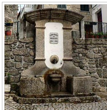
Um dos três monumentais fontanários construídos em Loriga pela Comunidade Loriguense de Manaus, Brasil.

O sismo de 1755 provocou enormes estragos na vila, tendo arruinado também muitas residências, incluindo a paroquial e aberto algumas fendas nas robustas e espessas paredes do edifício da Câmara Municipal construído no século XIII. Um emissário do Marquês de