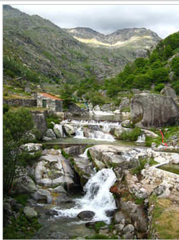
Praia fluvial de Loriga, num local conhecido por Chão da Ribeira onde está o chamado "Poço do Zé Lages".

arruinar a capela, reconstruíram-na depois com outro orago (Nossa Senhora do Carmo), e mudaram o nome do santo para São Ginês, um santo que nunca existiu. Este núcleo da povoação, que já esteve separado do principal e mais antigo, situado mais abaixo, é anterior à chegada dos romanos.